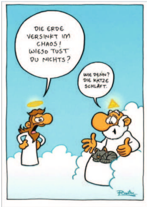
Karikatur von Ralph Ruthe

schläft!“ und meine damit, dass ich nicht bereit bin, die harmonische Schnurr- und Schmusezeit mit meinem Kater Findus zu unterbrechen.