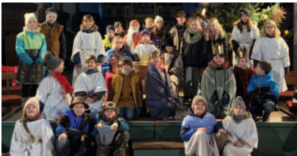
Krippenspiel Tangermünde 2024