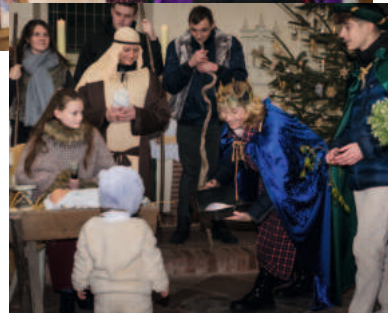
Miltern und Hämerten