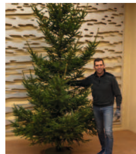
Christbaum mit Schulle